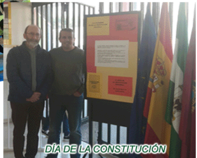
DÍA DE LA CONSTITUCIÓN