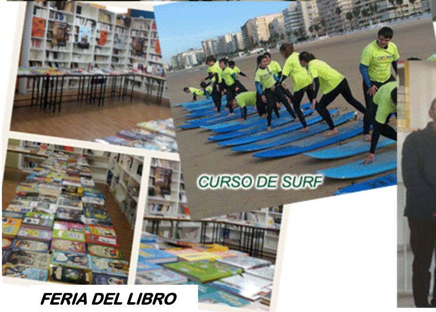
CURSO DE SURF