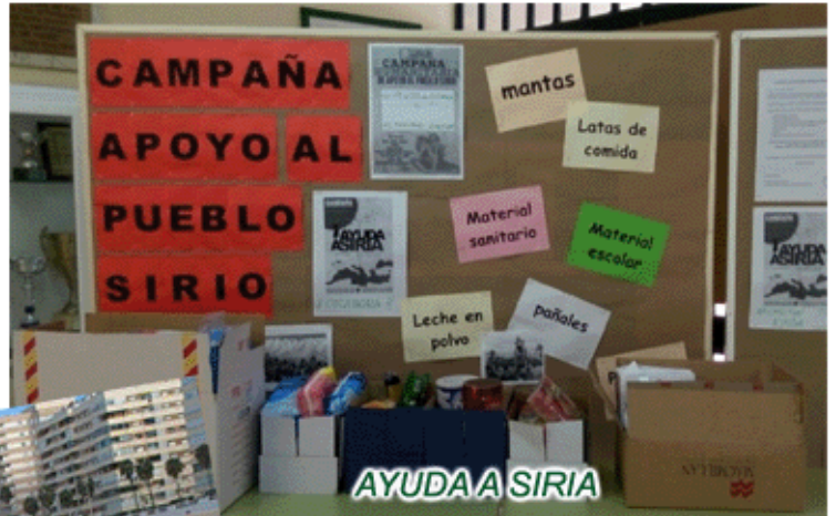
AYUDA A SIRIA