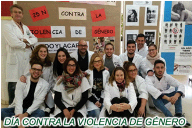
DÍA CONTRA LA VIOLENCIA DE GÉNERO