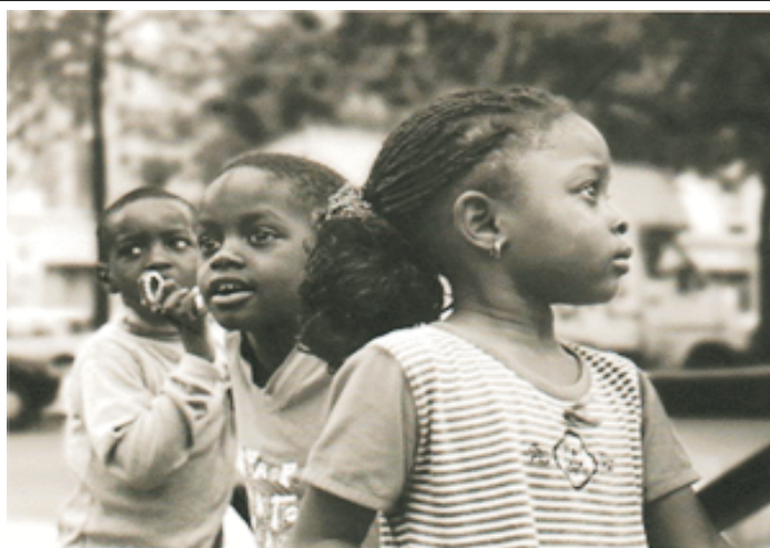
GABRIEL J. GARCÍA FOTOGRAFÍAS

Puedes ver una muestra en nuestra página web: www.iesbahiacadiz.net