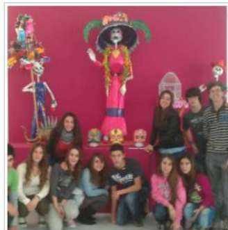
Visita a la Exposición de Arte Iberoamericano