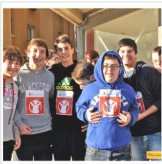
Marcha Solidaria por la Paz y la No Violencia