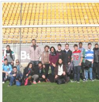
Visita del PCPI al Nuevo Estadio Ramón de Carranza