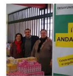
2015 Desayuno Andaluz 23 de feb. de 2015 fotos: 7

Últimas fotos en nuestra web: www.iesfernandoaguilar.es