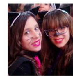
2015 Gala de Carnaval 19 de feb. de 2015 fotos: 28