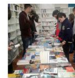
2014 Feria del Libro 2 de dic. de 2014 fotos: 6