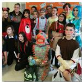
2016 Concurso de Disfraces 11 feb. 2016