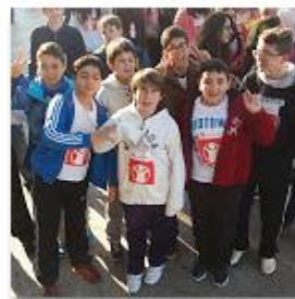
2016 Marcha Solidaria "Save the Children" 29 ene. 2016