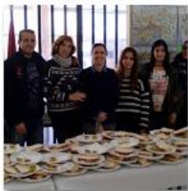
2016 Desayuno Andaluz 25 feb. 2016