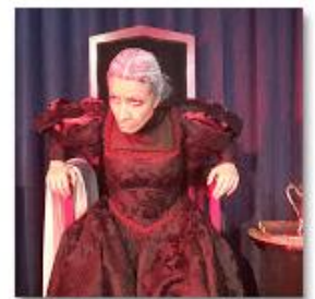
2016 Teatro "Juana La Loca" 26 ene. 2016