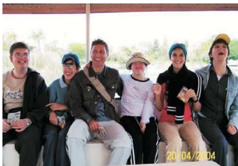
Excursión a Isla Mágica por los alumnos del Aula de Apoyo a la Integración (20 de Abril)