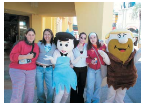
Viaje a Madrid de los alumnos de PGS y 1º GES (19-22 de Abril)