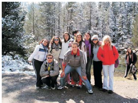
Viaje de Fin de Curso a Barcelona de los alumnos de BACHILLERATO. (12-18 de Abril)