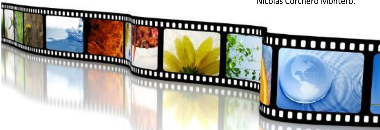
Nicolás Corchero Montero.